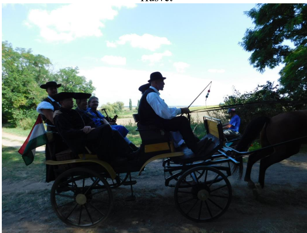
Pázmánd Fogathajtó verseny.