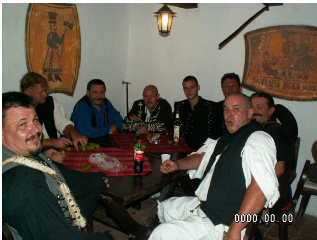
Nemesvámos betyár találkozó.