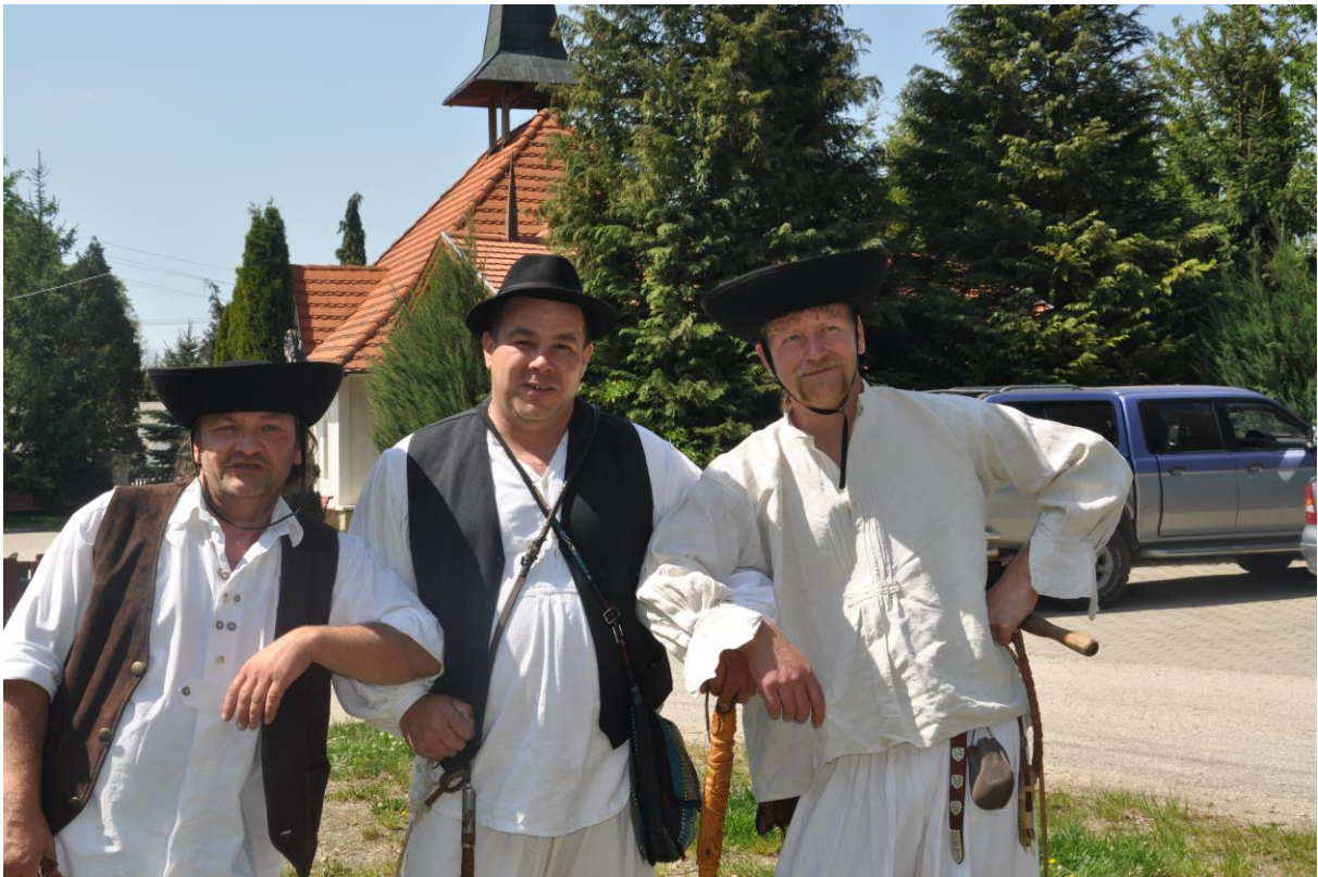
Majális a betyárokkal.