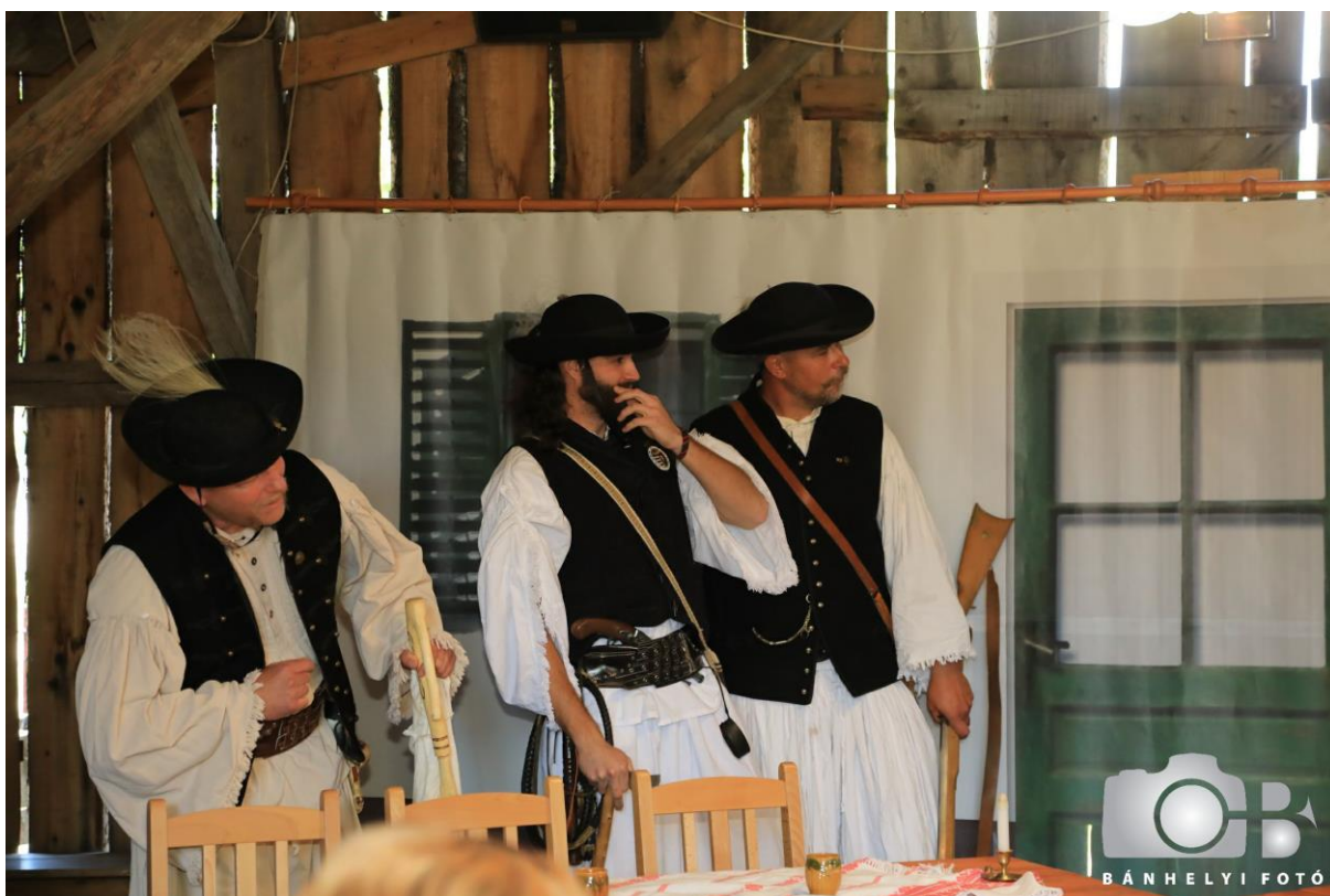
Kiscs6sz PajtaszínhĀzi fesztivĀl.