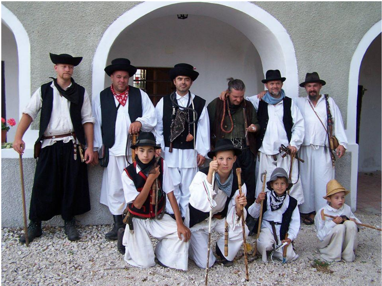
I. Betyár tábor