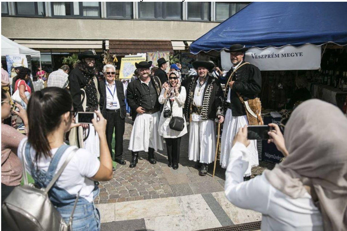
Magyar Értékek napja Budapest.