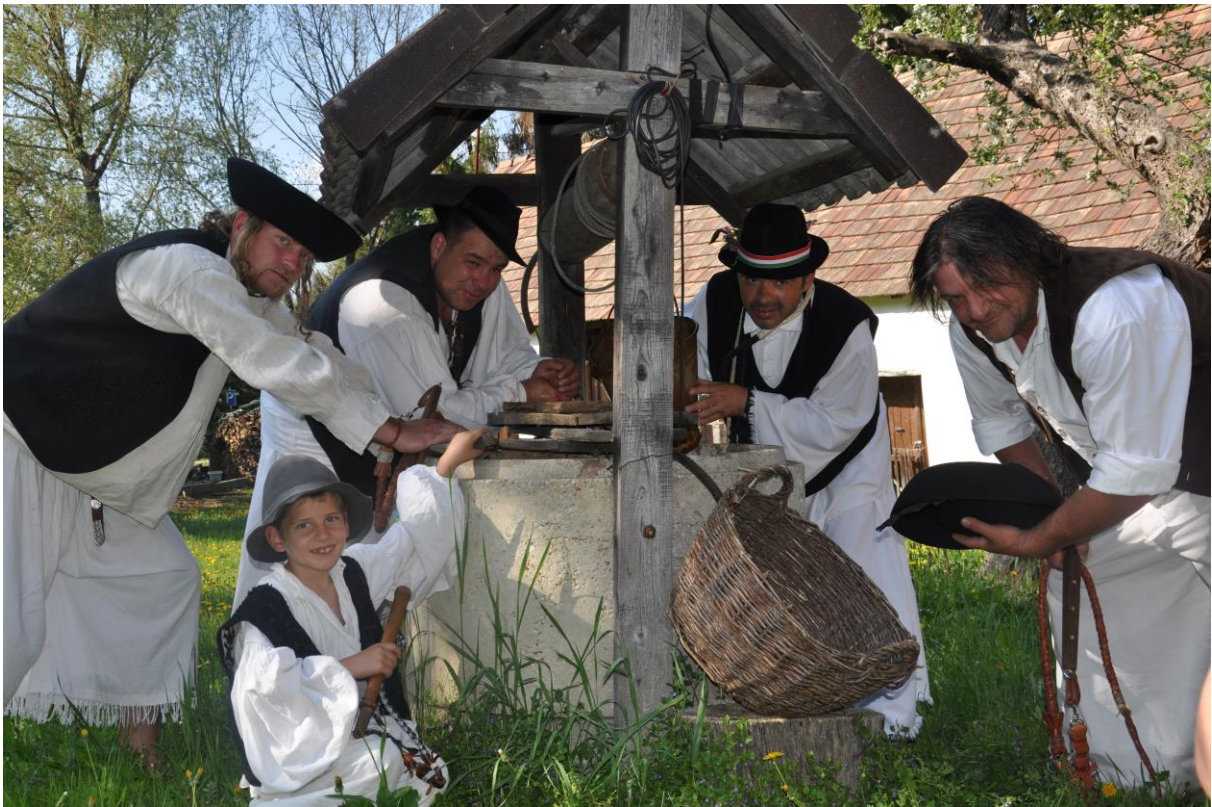
Majális a betyárokkal.