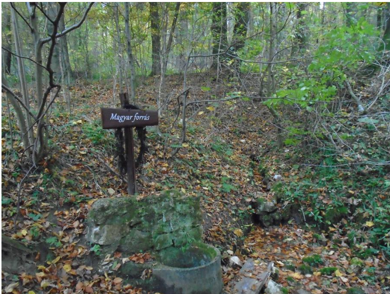
A Magyar Forrás és környéke