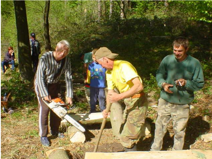
Munkálatok a Magyar forrásnál: készülnek az asztalok, padok, tisztítják a forrást